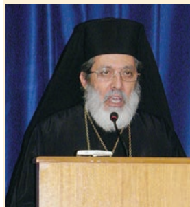
Ὁ Μητροπολίτης κ. ΜΑΚΑΡΙΟΣ

Ὁ Σεβασμιώτατος προσφώνωντας τοὺς παρόντες